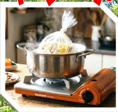
パッククッキングで クリームパスタ！