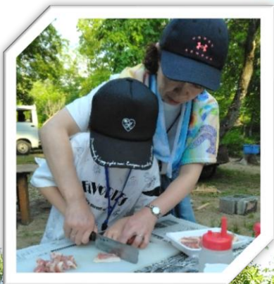
野外炊飯は 定番のカレーライス