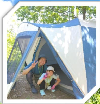
テントに泊まろう！