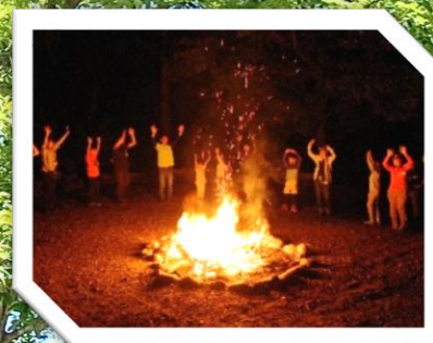
火を囲んで キャンプファイヤー