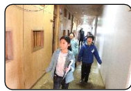
館内ウォークラリー

3月22日（日）、県内外から14名の小学校3・4年生のみなさんに参加していただき、「いいでプレキャンプ」を開催しました。初めて会った仲間ともすぐに打ち解け、館内ウォークラリー、ポークカレーづくり、おたからハイキング、まきわり＆火おこし＆おやつタイムといった活動に、楽しみながら協力して取り組む様子が見られました。参加者のみなさんには、各校での活動や宿泊体験学習で今回の経験をぜひ活かしてほしいと思いますし、様々な体験を通して主体性や協働性、リーダーシップをさらに高めてほしいと願っています。