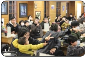
まずはみんなでアイスブレイク！

12月14日（日）、24家族70名の皆様に参加していただき、第2回自然大好き！いいでクラブ「おかしの家で森のクリスマス会をひらこう」を開催いたしました。開催日は寒い一日ではありましたが、会場は終始温かい雰囲気になり、ご家族の笑顔と笑い声のあふれる、すてきなクリスマス会になりました。