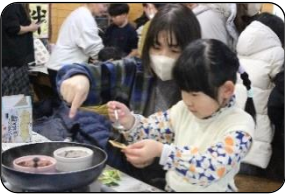
チョコレートを使っておかしの家を組み立てていきます