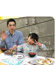
焼きあがったピザを食べてみると…「おいしい！」みんなの笑顔があふれました！！