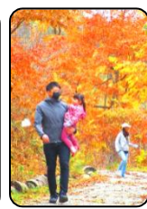
焼きあがるまで、館内プログラム「さつまいもマンを探せ」と紅葉の中でのフィールドアスレチックを楽しみました