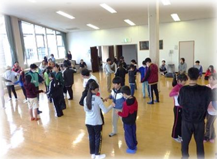
アイスブレイクで緊張をほぐします

10月26～27日に秋キャンプを行いました。今回のキャンプは自分たちで献立を決め、その材料を予算内で買い、調理することと、紅葉狩り登山が目玉でした。班ごとに個性があり、いろいろな料理を見ることができました。紅葉狩り登山（白鷹山）も天候に恵まれ、雲海を見たり、山形盆地を見たり、置賜の様子も見ることができ、大満足の登山でした。2日間を通して主体的に動ける子ども達が多くなったように思います。また、不便な2日間を同じ目的をもった異学年の仲間と過ごすことはとても素晴らしい体験です。冬キャンは2月1・2日です。学校からも是非薦めていただければと思います。