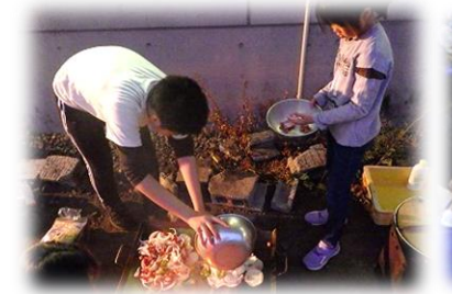
うまく野外炊飯できるかな