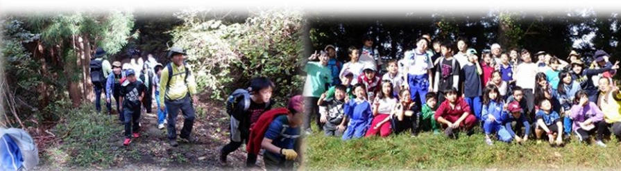
2日目 紅葉狩り登山（白鷹山）に出発！