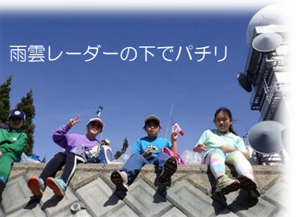
雨雲レーダーの下でパチリ