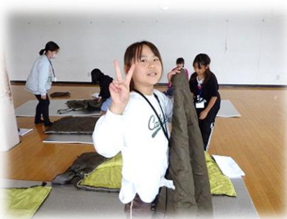
ピバークの準備をして