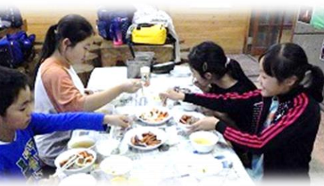
どの班も上手にできました。