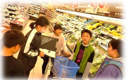
代金を計算して買い物をしました