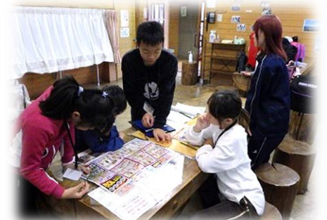
野外炊飯のメニューを班で決めます