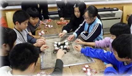
夜は焼きマッシュマロ