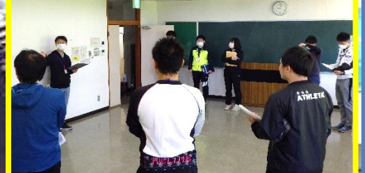
野外活動フロウチャート実習