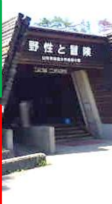
施設・館内設備案内