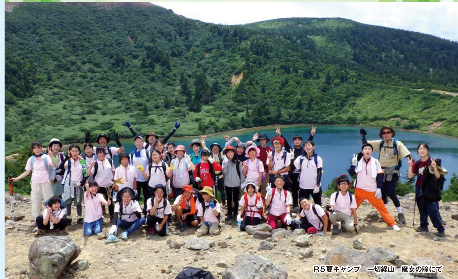
R5夏キャンプ 一切経山 魔女の瞳にて